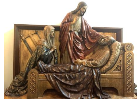
Foto: Het sterven van Jozef in nabijheid van Jezus en Maria. Zo werd Sint Jozef patroon van een zalige dood. Beeld in de Heilig Kruiskapel in Kevelaer.

(Dagboek 19 maart 1939) Jozef is de zwijgende, dienende en gehoorzame heilige. Inderdaad wordt er in de Evangelieën geen enkel woord van hem vermeld. Wel lezen we daar hoe hij telkens weer gehoorzaamde aan de wenken van God (bijv. Mattheus 1,24). Heel zijn leven en persoon stelde hij in dienst van Jezus en Maria, van Gods plan met zijn leven. Grote heiligheid hoeft dus niet te bestaan uit veel woorden, uit spectaculaire wonderen of mystieke fenomenen. Heiligheid is leven volgens Gods wil en daardoor opgeteerd worden door liefde voor God en de naaste. Dat kan ook in stilte en verborgenheid, zoals Sint Jozef laat zien.